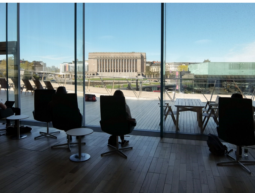
Oodi-kirjastosta on näkymät Eduskuntatalon suuntaan.