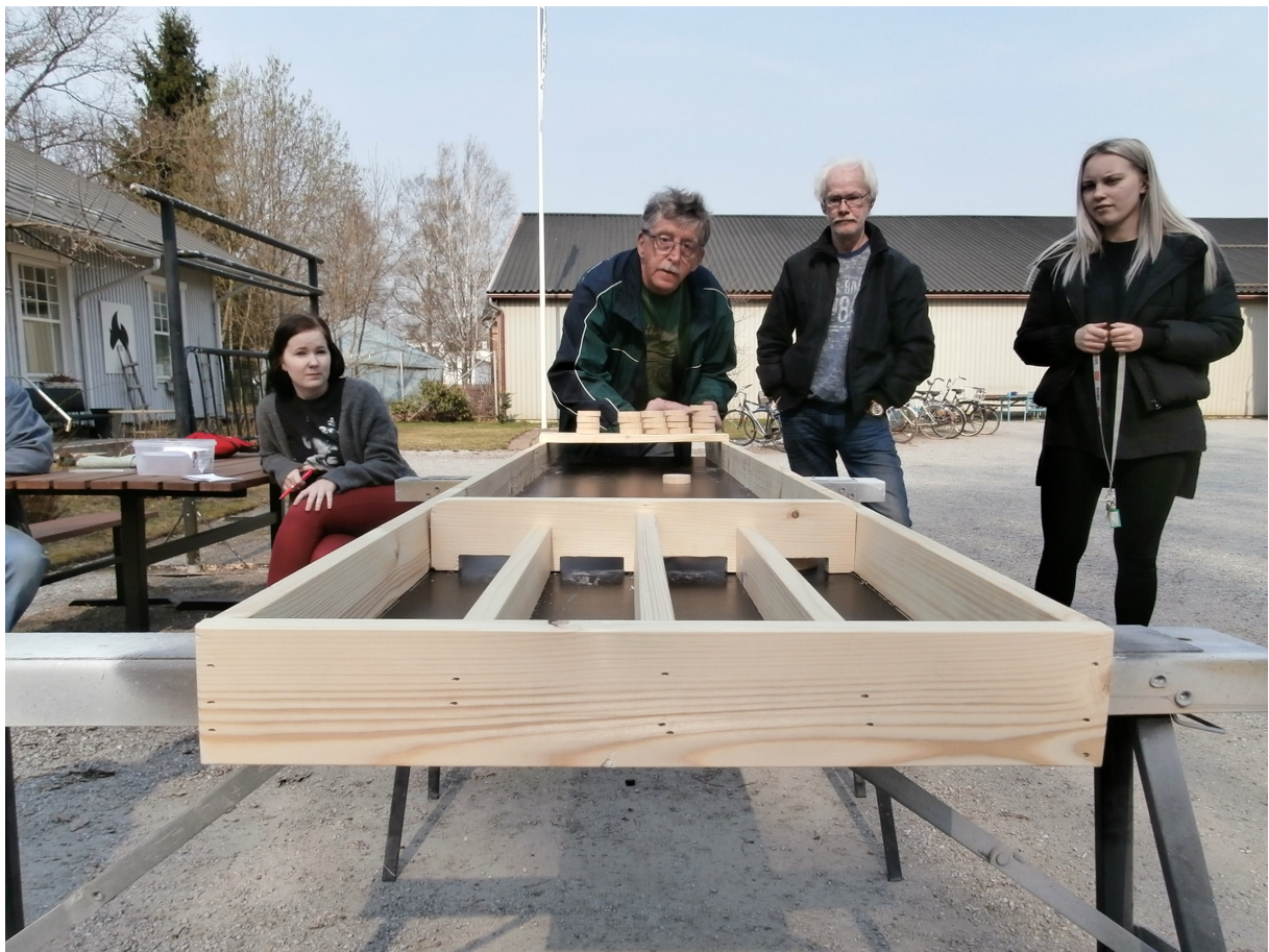
Ulkopelit kuuluvat olennaisena osana yhdistyksen kesään.