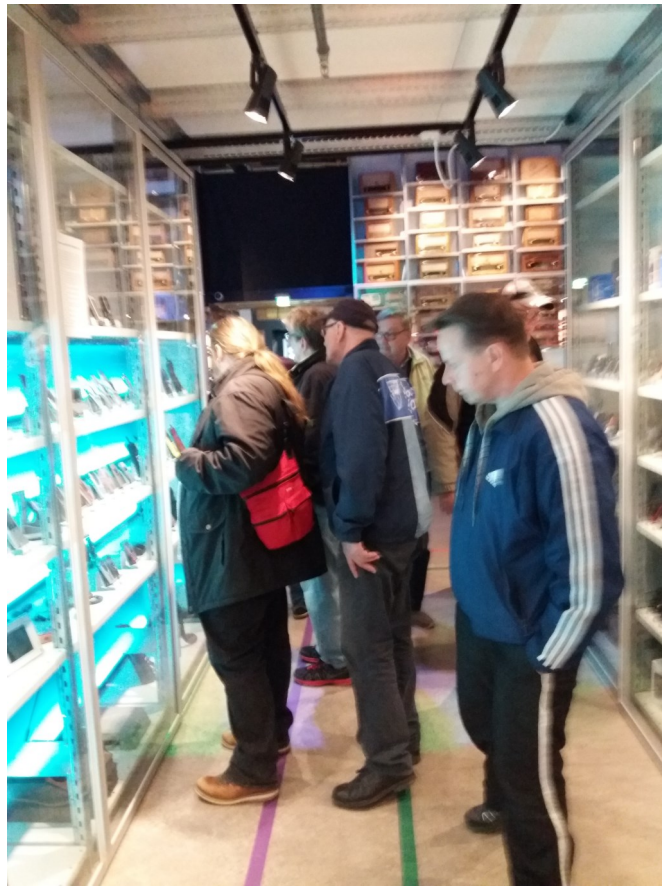
Vaihtoehdon iskuryhmä Salon elektroniikkamuseossa.