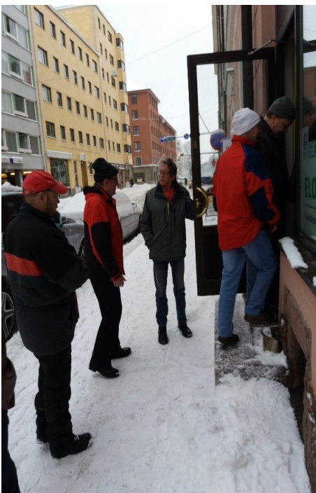
Elokolo sijaitsee Turun ydinkeskustassa Yliopistonkadulla

Elokolon toiminta vaikutti melko samanlaiselta kuin Salossakin toki sijainti Turun ydinkeskustassa (Yliopistonkatu 10) tuo hyvin kävijöitä, päivittäin noin kolmisen kymmentä kävijää. Elokolon toimintaa pyörittää Ehyt ry yhdessä Turun Elämäntapayhdistyksen kanssa. Paikka työllistää yhden työntekijän lisäksi työkokeilussa ja palkkatuella olevia henkilöitä näiden lisäksi vapaaehtoisvoimin pyöriivät erilaiset ryhmätoiminnot ja teemapäivät sekä tempaukset. Iltaisin tiloissa kokoontuvat erilaiset vertaistukiryhmät. Torstaisin tarjotaan kotiruokalounas, muina päivinä on mahdollisuus syödä aamupuuroa ja kahvitella. Hinnat ovat erittäin edulliset ja erillistä jäsenyyttä ei vaadita vaan kaikki ovat tervetulleita.